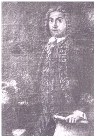
El Brigadier Don Lorenzo de Solís (lienzo de F. Reyser).

■ Cartagena de Indias Publicaciones de la Escuela de Estudios Hispano Americanos de Sevilla. Sevilla, 1951, página(s): 166-168. 170-174, 255-257 Enrique Marco Dorta